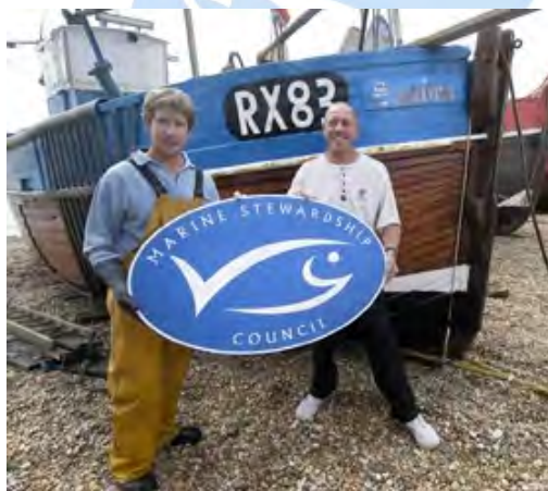
Stand: Januar 2010

Bevor ein Fischerzeugnis mit MSC-Siegel im Handel erscheinen kann muss jedes Unternehmen, das den Fisch weiterverarbeitet oder umverpackt, eine unabhängige Betriebsprüfung durchlaufen. Sie stellt sicher, dass der Fisch lückenlos bis auf das Boot zurückverfolgt werden kann, auf dem er gefangen wurde. Nur so kann der Konsument sicher sein, dass in einem Produkt mit MSC-Siegel auch wirklich nachhaltig gefangener Fisch enthalten ist.